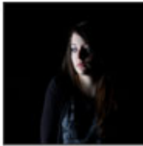
A predominantly black photo also known as lowkey