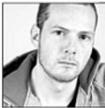
A predominantly white photo, also known as highkey