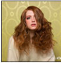
Even exposure throughout the whole photo

Une exposition moyenne... Sans extrêmes.