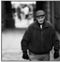
A photo with high contrast

Beaucoup de contraste... Y'a du très sombre Et du très clair.