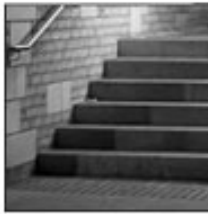
A photo with low contrast

Peu de contraste... Tout est de la même exposition.